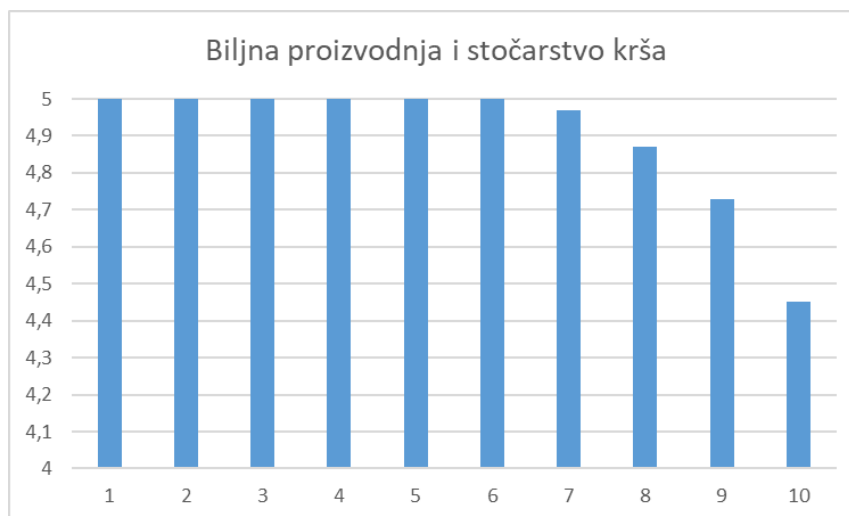
Grafikon 1.1. Zimski semestar 2021./2022.

U anketi je vrednovano 10 nastavnika koji su u zimskom semestru akademske godine 2021./2022. sudjelovali u nastavnom procesu. Na grafikonu 1.1. su prikazane prosječne ocjene svih ocjenjivanih nastavnika u zimskom semestru. Na kraju je navedena prosječna ocjena na razini studija za zimski semestar.