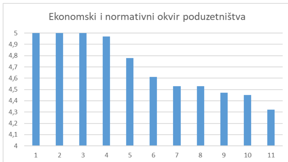
Grafikon 4.1. Zimski semestar 2021./2022.

U anketi je vrednovano 11 nastavnika koji su u zimskom semestru akademske godine 2021./2022. sudjelovali u nastavnom procesu. Na grafikonu 4.1. su prikazane prosječne ocjene svih ocjenjivanih nastavnika u zimskom semestru. Na kraju je navedena prosječna ocjena na razini studija za zimski semestar.