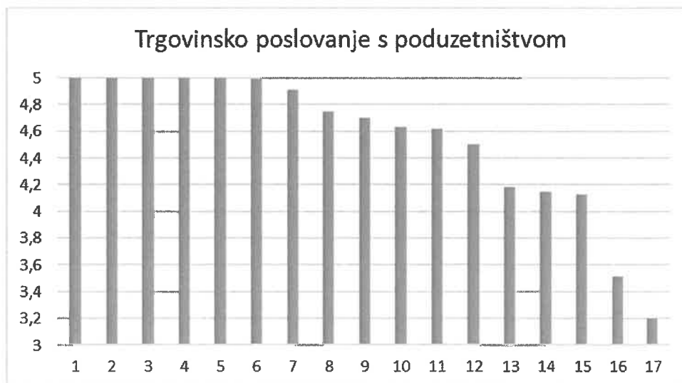
Grafikon 1.1. Ljetni semestar 2021./2022.

U anketi je prema Izvedbenom planu nastave za akademsku godinu 2021./2022. po pojedinim predmetima omogućeno vrednovanje 26 nastavnika koji su u ljetnom semestru akademske godine 2021./2022. sudjelovali u nastavnom procesu. Na grafikonu 1 .1. su prikazane prosječne ocjene ukupno 17 ocijenjenih nastavnika u ljetnom semestru. Na kraju je navedena prosječna ocjena na razini studija za ljetni semestar.