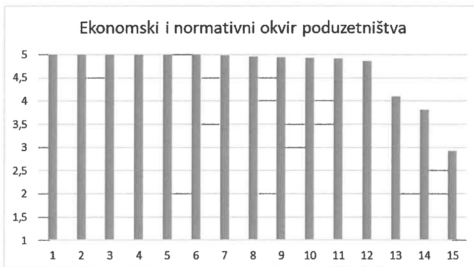
Grafikon 4.1. Ljetni semestar 2021./2022.

Prosječna ocjena nastavnika na razini studija za ljetni semestar bila je 4,70. Jedan nastavnik ocijenjen je ocjenom manjom od 3,00 te će se prema istom poduzeti korektivne mjere.