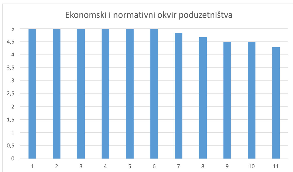
Grafikon 4.1. Ljetni semestar 2020./2021.

Prosječna ocjena nastavnika na razini studija za ljetni semestar bila je 4,80.