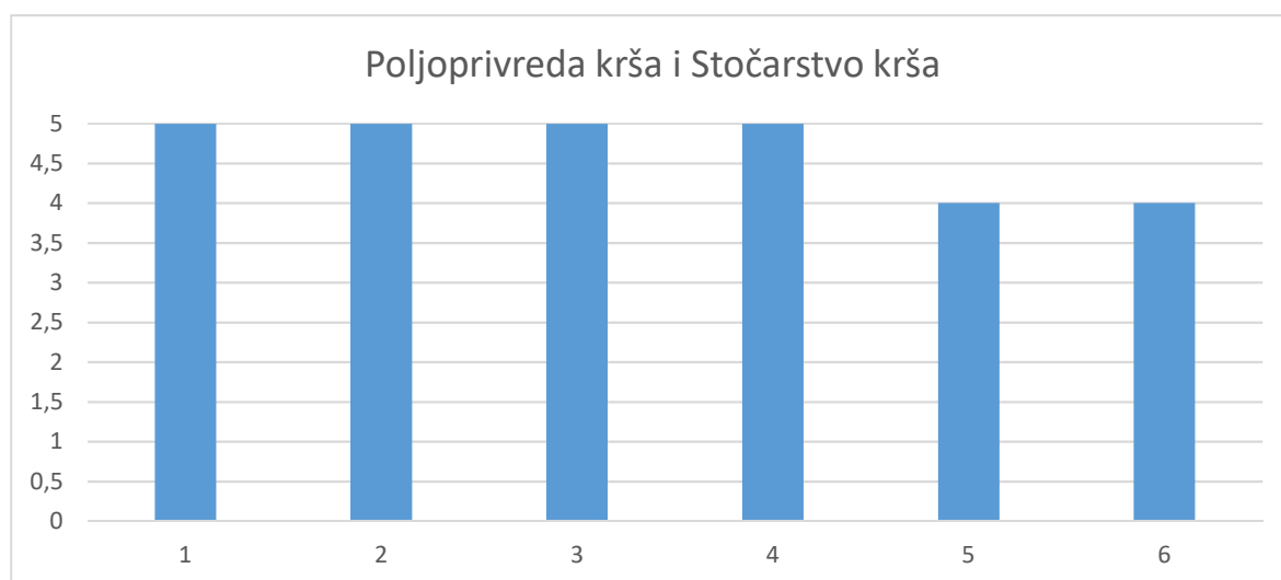
Grafikon 1.1. Ljetni semestar 2020./2021.

U anketi je vrednovano 6 nastavnika u ljetnom semestru koji sudjeluju u nastavnom procesu na Veleučilištu tijekom 2020./2021.ak.godine. Na grafikonu 1.1. su prikazane prosječne ocjene svih ocjenjivanih nastavnika u ljetnom semestru. Na kraju su navedene prosječne ocjene na razini studija za ljetni semestar